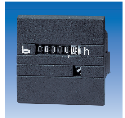
Typ 632, 632.1, 634, 634.1, 630, 630.1, 638, 638.1