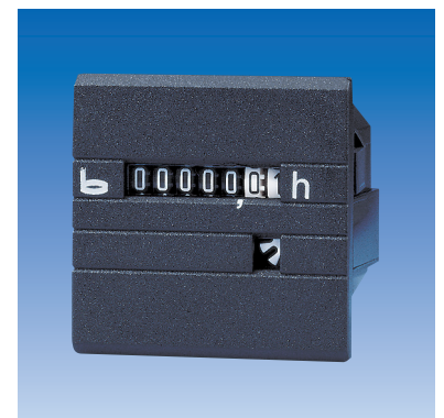
Typ 632.2, 632.3, 634.2, 634.3, 630.2, 630.3, 638.2, 638.3