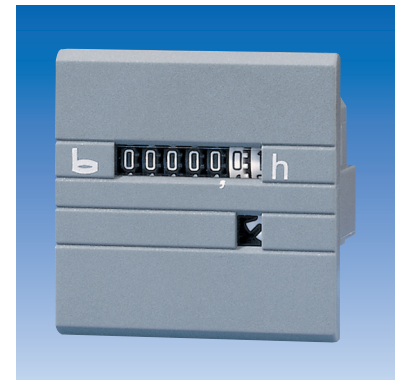
Typ 631, 631.1, 633, 633.1, 629, 629.1, 637, 637.1