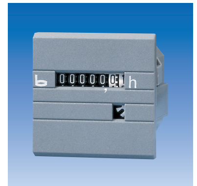
Typ 631.2, 631.3, 633.2, 633.3, 629.2, 629.3, 637.2, 637.3